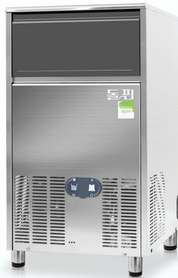
MODEL | B55