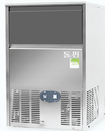
MODEL | B45