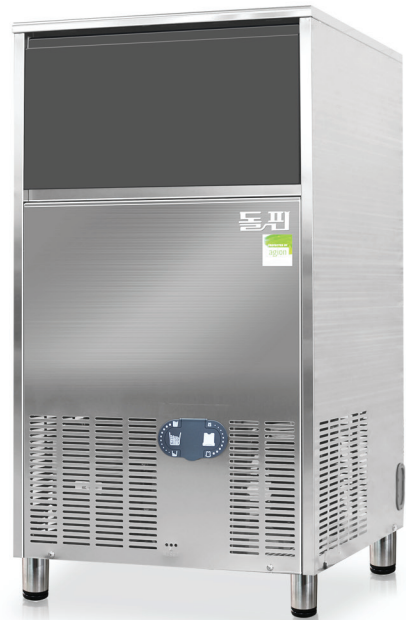
MODEL | B80