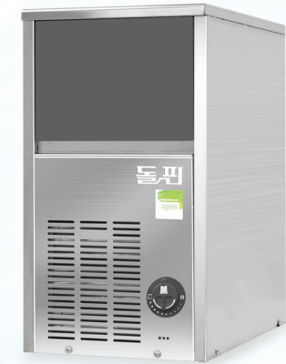
MODEL | B25